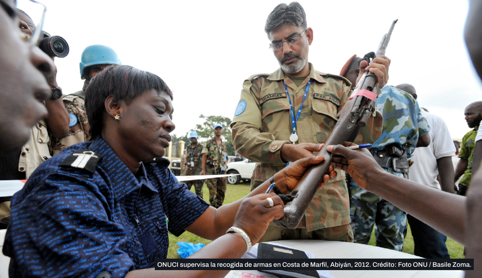
ONUCI supervisa la recogida de armas en Costa de Marfil, Abiyán, 2012.