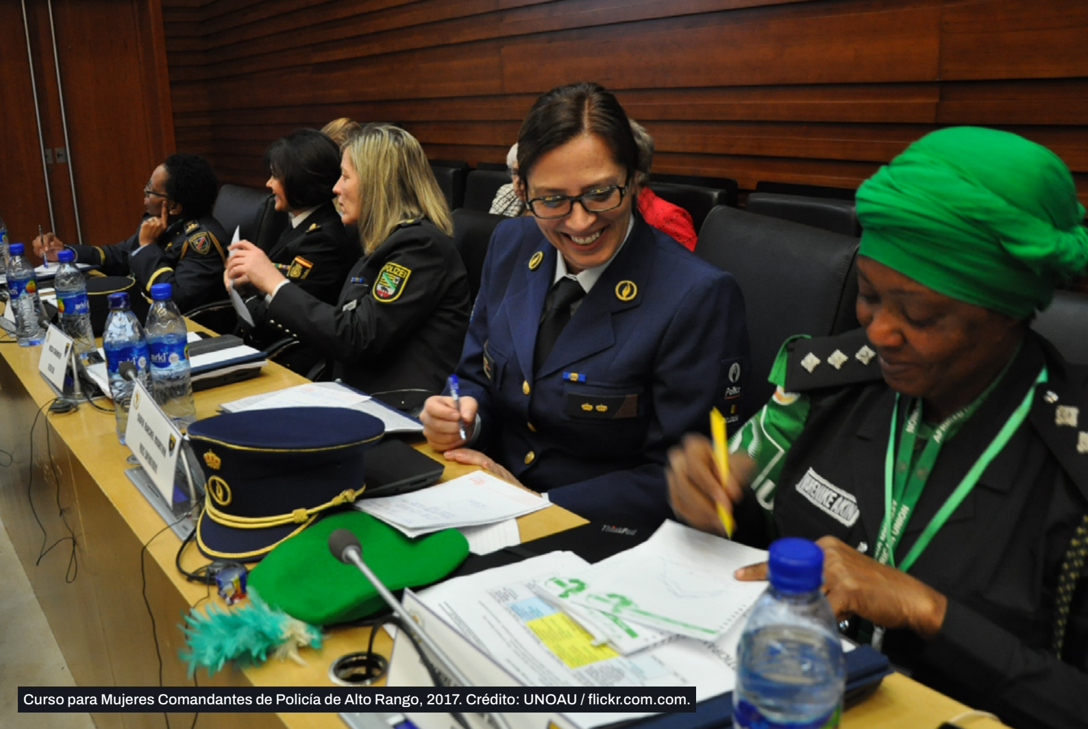
Curso para Mujeres Comandantes de Policía de Alto Rango, 2017.

Otras posibles acciones incluyen las siguientes: