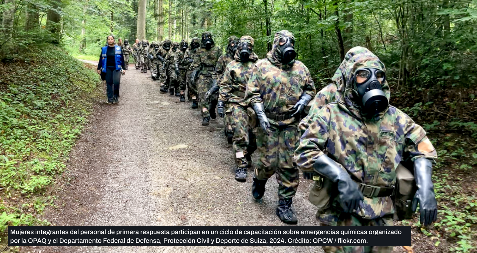
Mujeres integrantes del personal de primera respuesta participan en un ciclo de capacitación sobre emergencias químicas organizado por la OPAQ y el Departamento Federal de Defensa, Protección Civil y Deporte de Suiza, 2024.