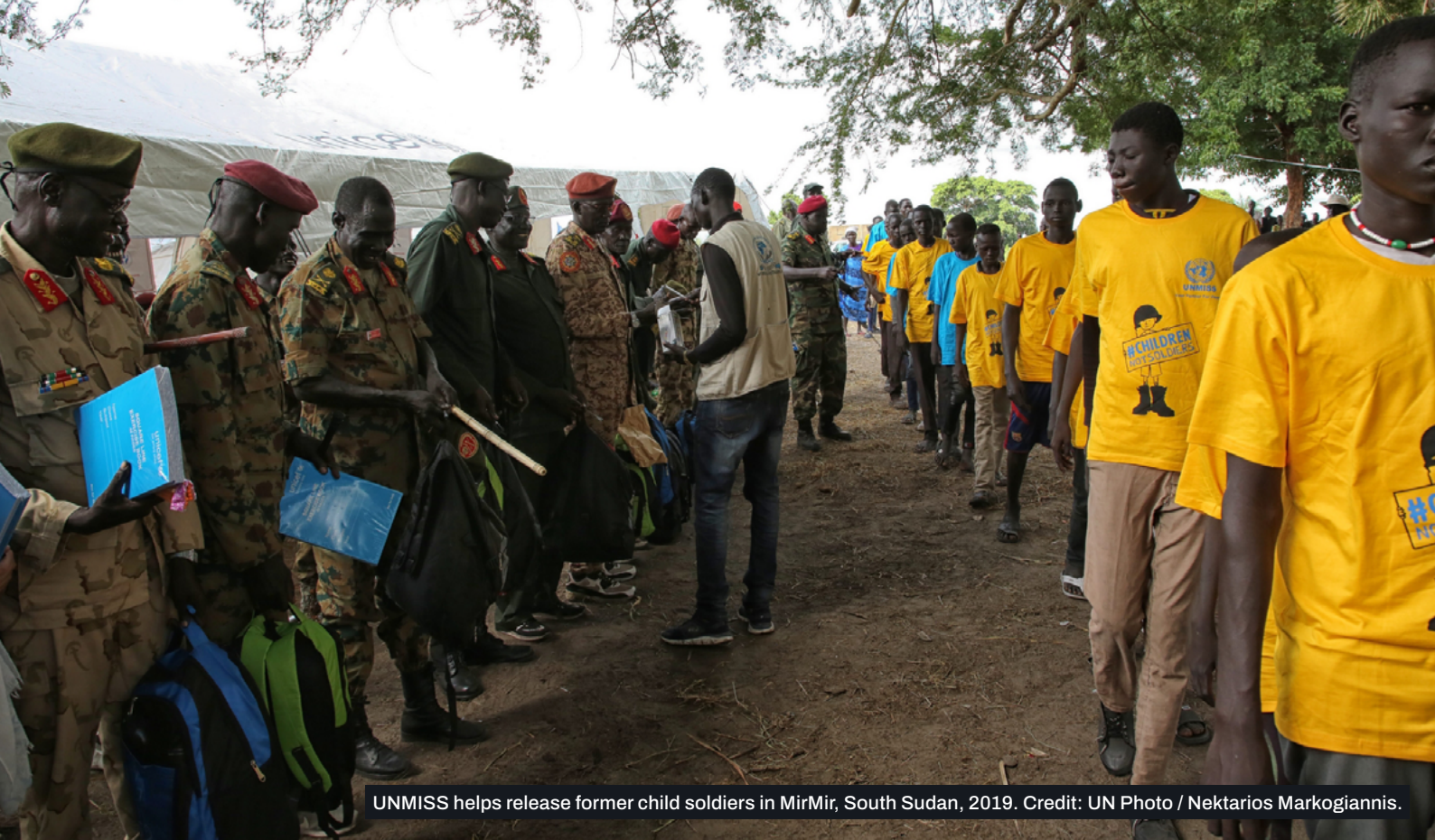
UNMISS helps release former child soldiers in MirMir, South Sudan, 2019.

Los hombres, en especial los hombres jóvenes, suelen ser quienes tienen más probabilidades de resultar víctimas de la violencia relacionada con las armas de fuego (tanto en tiempos de paz como de conflicto), así como de accidentes y suicidios con arma de fuego. 5 Esta estrecha relación entre los hombres y las armas de fuego suele vincularse a determinadas concepciones o formas de masculinidad, como las masculinidades militarizadas, las masculinidades protectoras, las asociadas al rol de proveedor económico (por ejemplo, en el caso de actividades ilícitas) o ciertas masculinidades vinculadas a las pandillas. 6 Los esfuerzos de desarme y control de armas deben tener en cuenta estas dinámicas o, mejor aún, buscar transformar esta relación masculinizada con las armas de fuego.